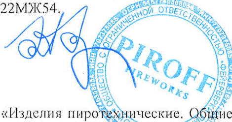
Схема сертификации 7с.

ДОПОЛНИТЕЛЬНАЯ ИНФОРМАЦИЯ ГОСТ Р 51270 «Изделия пиротехнические. Общие требо- вания безопасности». Хранить в сухом помещении не ближе 0,5 м от нагревательных приборов при температуре не выше +30° С, исключая попадание на упаковку прямых солнечных лучей и атмо- сферных осадков. Срок годности 3,5 года.